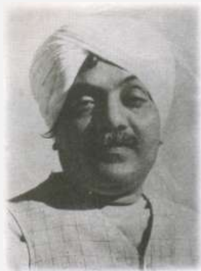
अरविंद सिपाही 28 अक्टूबर 1906 - 9 मार्च 1947